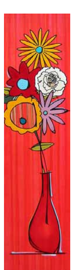
Bélanger // Couleur passion // 48x12