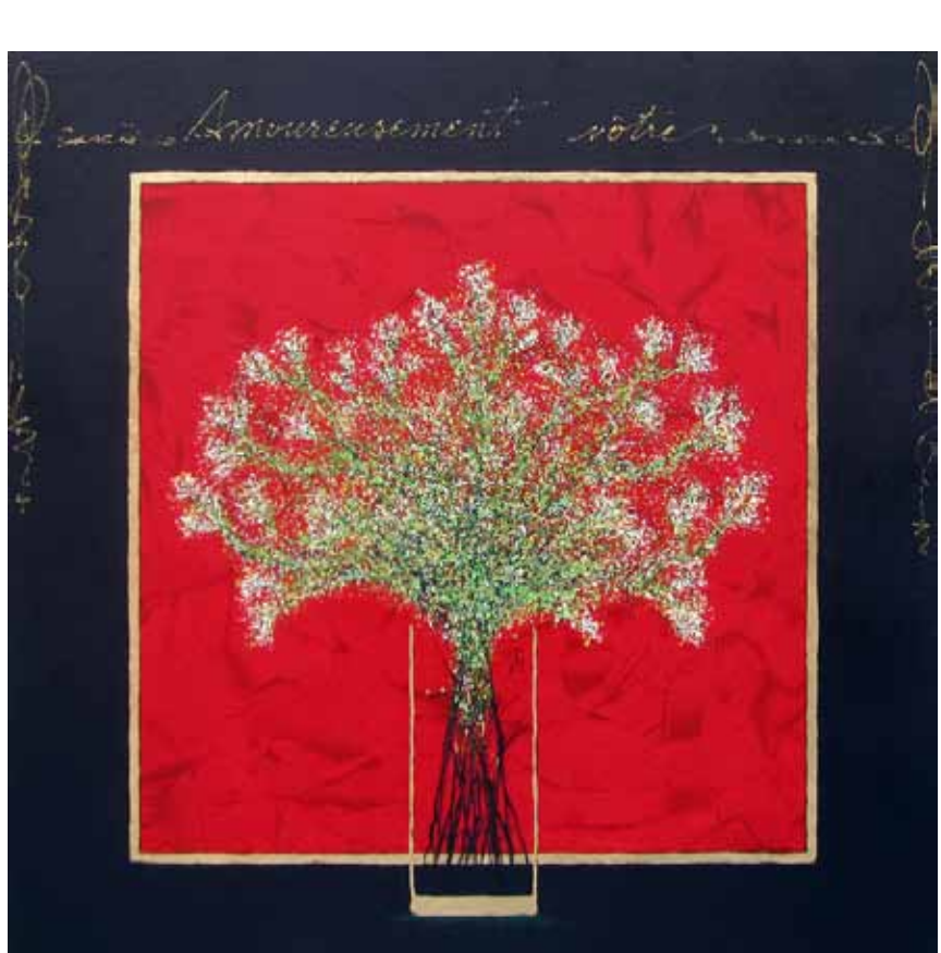
Marsan // Amourusement vôtre // 30x30