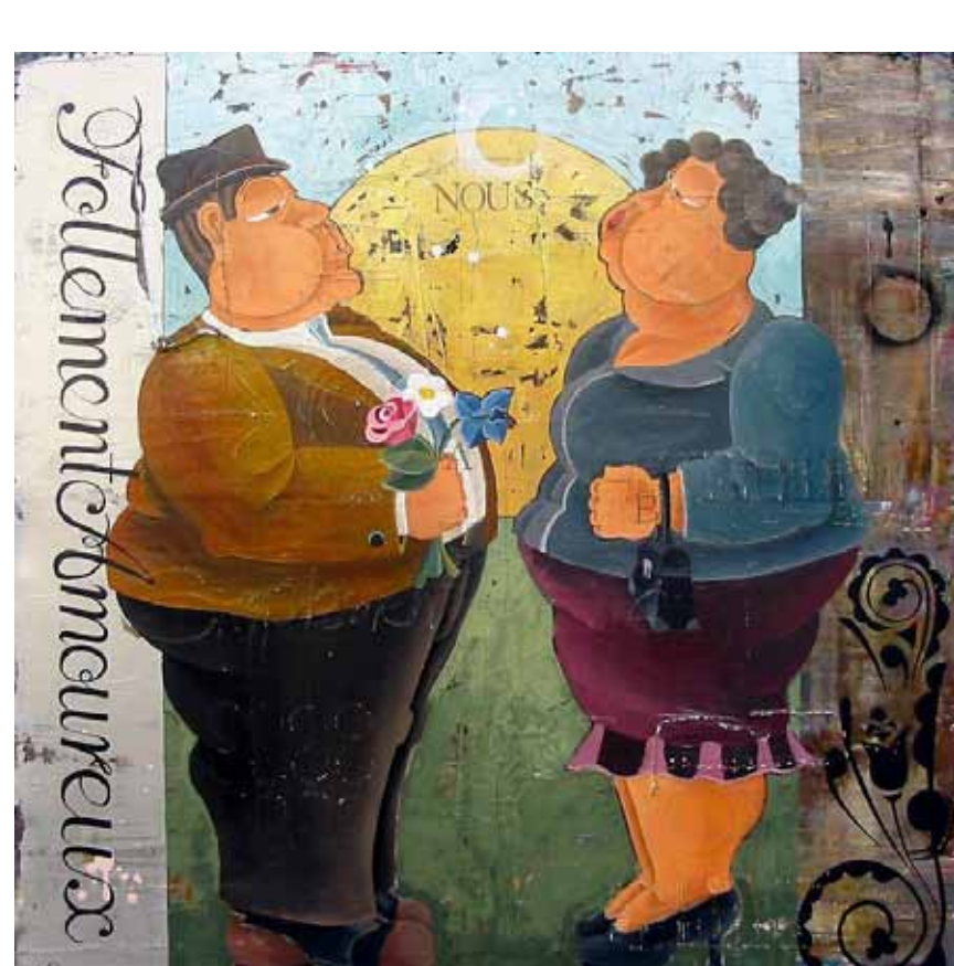
Therrien // Follement amoureux // 40x40