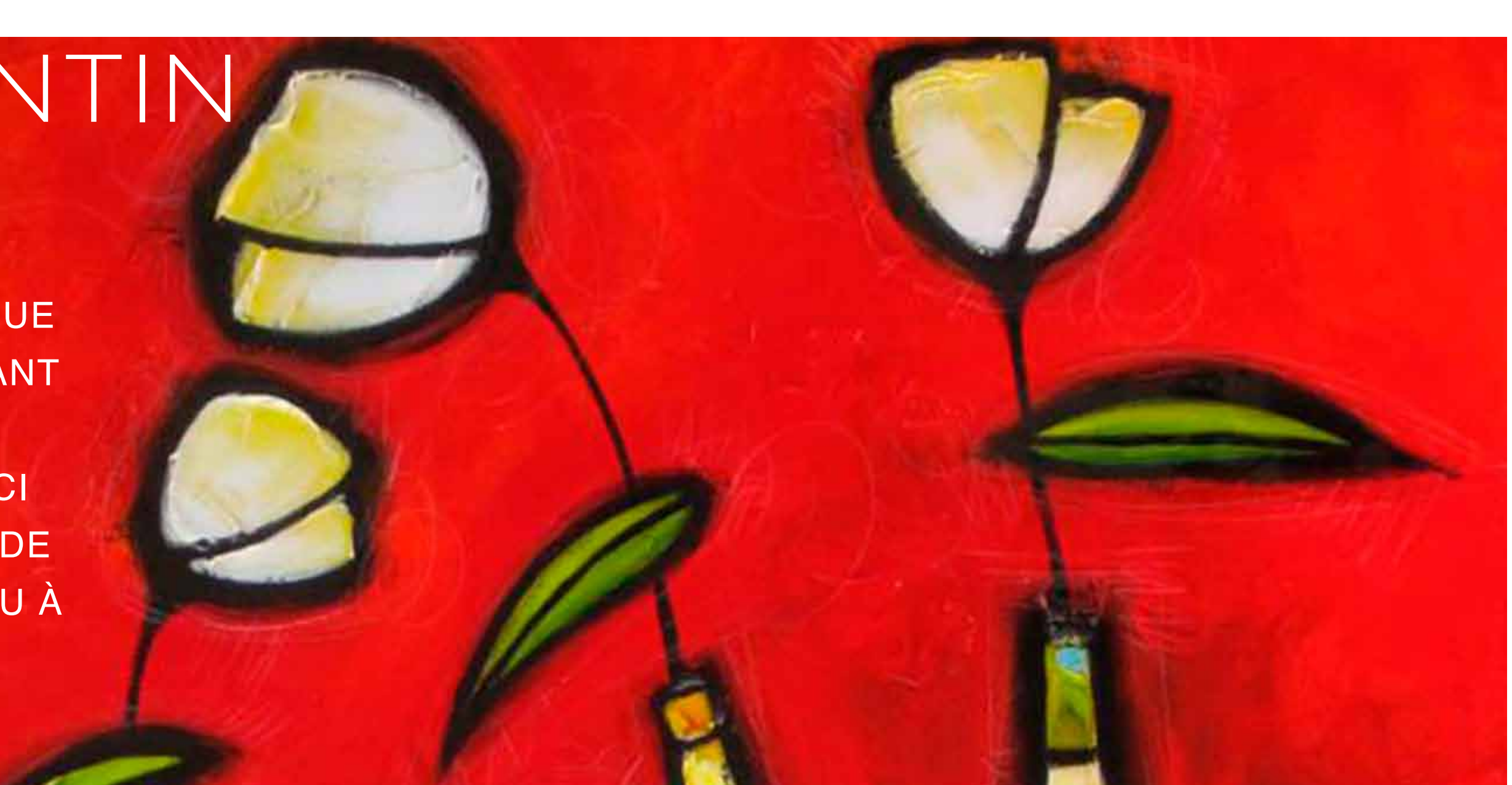
Mélan // Le vrai amour // 48x48

LE DÉCOMPTE EST COMMENCÉ, PLUS QUE DEUX SEMAINES AVANT LA DATE FATIDIQUE DU 14 FÉVRIER. VOICI NOS SUGGESTIONS DE CADEAUX À FAIRE OU À SE FAIRE OFFRIR !