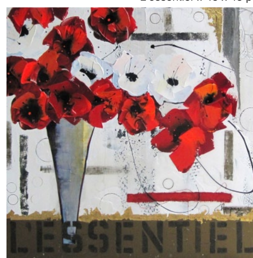
L'essentiel :: 48 x 48 po