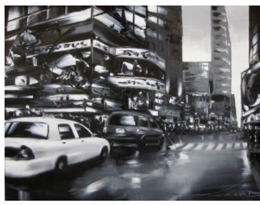
Blouin :: Leaving for the city :: 36 x 48 po

L'artiste est en permanence à la galerie Beauchamp Contemporain, située au 69 rue St-Pierre.