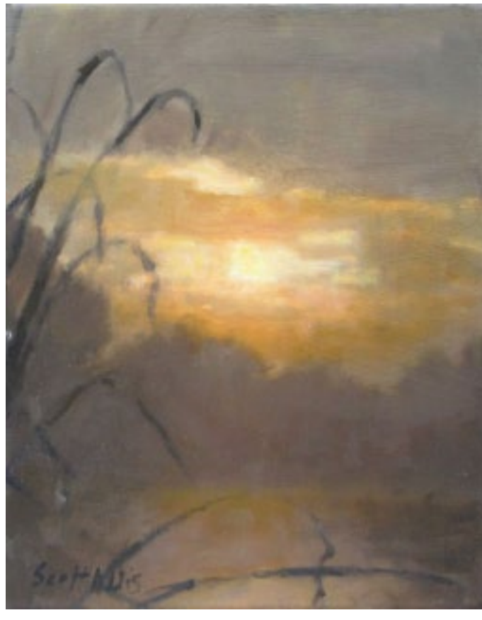
Kingston morning :: 10 x 8 po