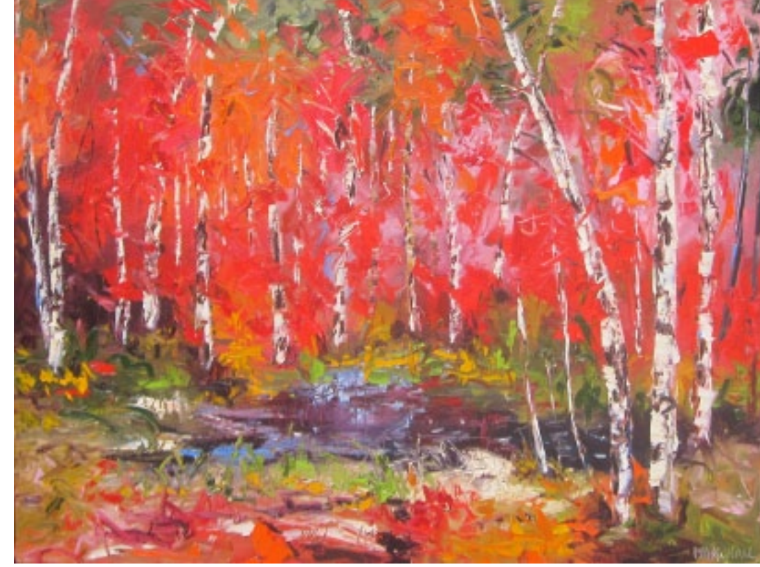
Red reflection :: 30 x 40 po