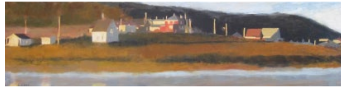
Intimacy :: 12 x 48 po