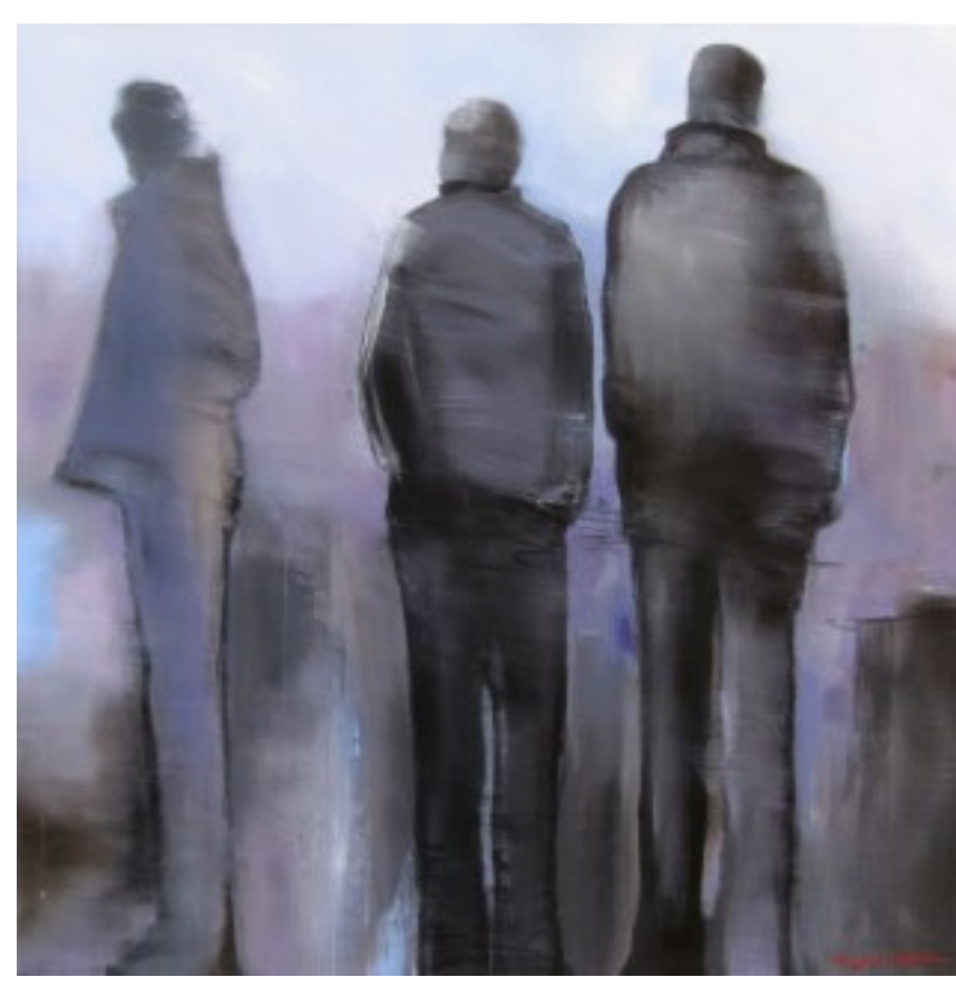
Decisions taken :: 48 x 48 po