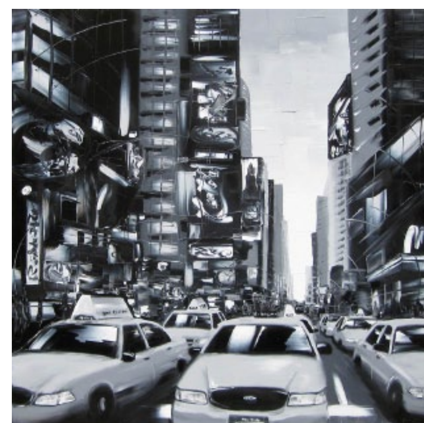
Blouin :: Welcome to NY :: 48 x 48 po