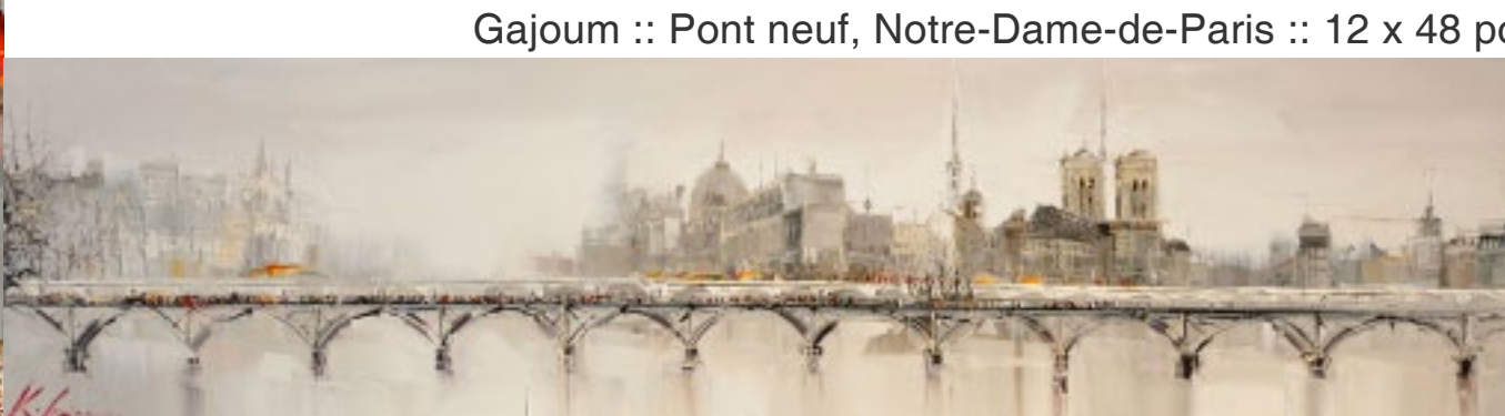
Gajoum :: Pont neuf, Notre-Dame-de-Paris :: 12 x 48 po

Nouvelles œuvres de l'artiste Kal Gajoum à l'Espace-galerie B8. Du 25 novembre au 30 décembre 2011, découvrez l'univers fascinant de Kal Gajoum. Ses tableaux vous révéleront la beauté saisissante de grands centres urbains, et surtout le talent indéniable d'un artiste hors du commun.