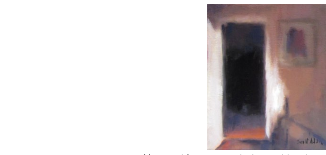
Alone with my certainties :: 10 x 8 po