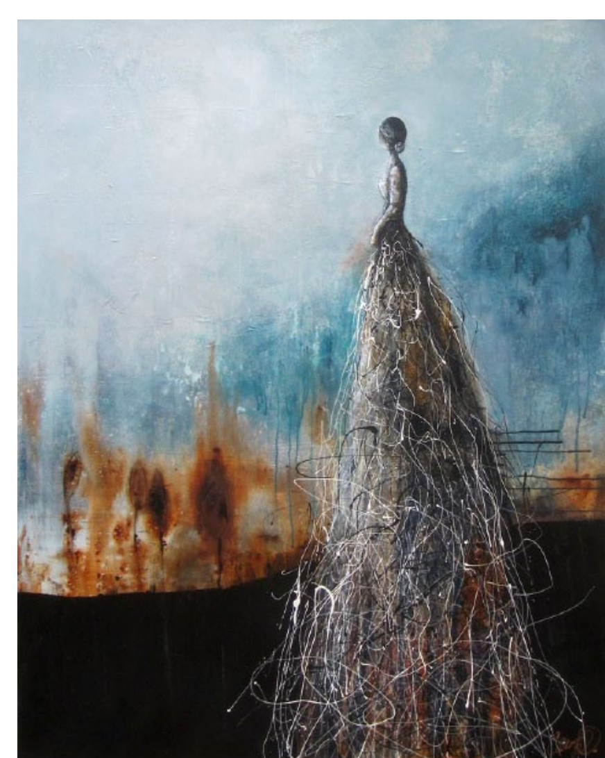
Léanie :: 60 x 48 po

Cette artiste autodidacte explore depuis une dizaine d'années les ressources de l'acrylique, dans un modus vivendi entre l'eau, l'alcool, et les techniques mixtes. Privilégiant la forme humaine, sa manière très épurée de rendre la forme et l'atmosphère, à travers des couleurs diluées plutôt que saturées, confère à sa production un caractère subtil, intemporel et onirique à sa représentation. Cette nouvelle artiste est à découvrir à la Galerie Beauchamp située au 50, rue Notre-Dame.