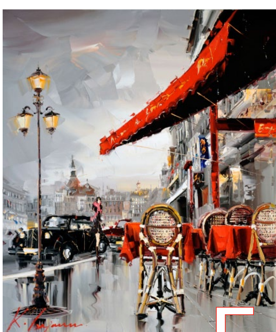
Gajoum :: Bonjour Trouville :: 36 x 30 po