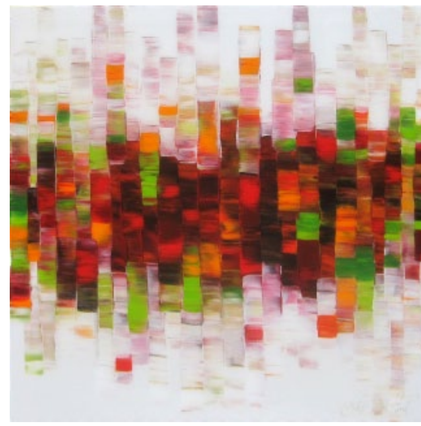
Au contour de la nature :: 30 x 30 po