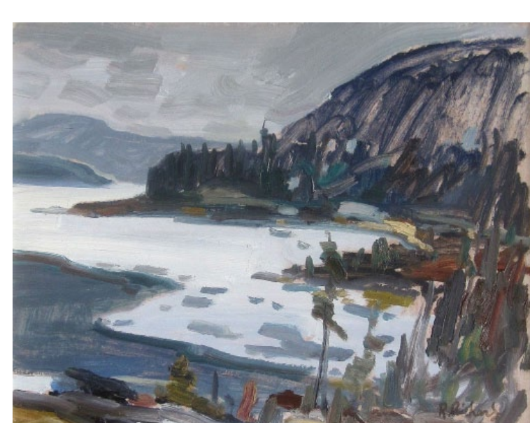
René Richard :: Scène d'hiver :: 16 x 20 po